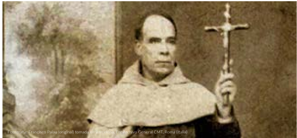
Fotografía: Francisco Palau (original) tomada en Barcelona. En: Archivo General CMT, Roma (Italia)