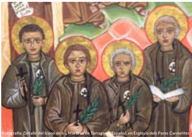
Fotografía: Detalle del Icono de los Mártires de Tarragona (España), en Iglesia de los Pares Carmelitas